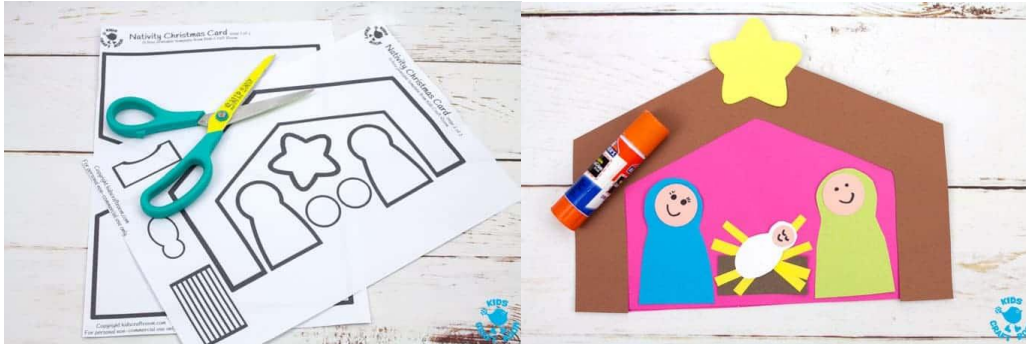
Modelo para imprimir abaixo