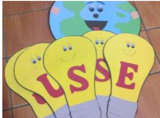
4. Decoração com luz.