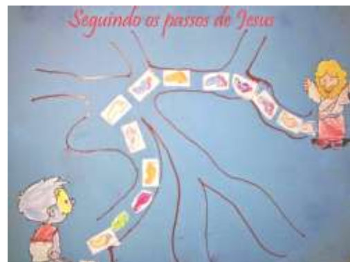
5. Caminho com pegadas.