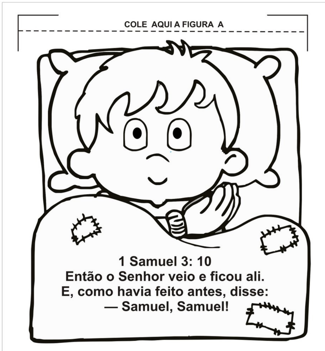
FIGURA - B

RECORTE A SEGUNDA PARTE DO VERSÍCULO E COLE ATRÁS DA FIGURA A