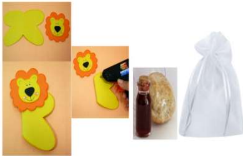
MOLDE DO LEÃO

Leão agarradinho – dentro é um prendedor e deve segurar um saquinho com o pão e cálice.