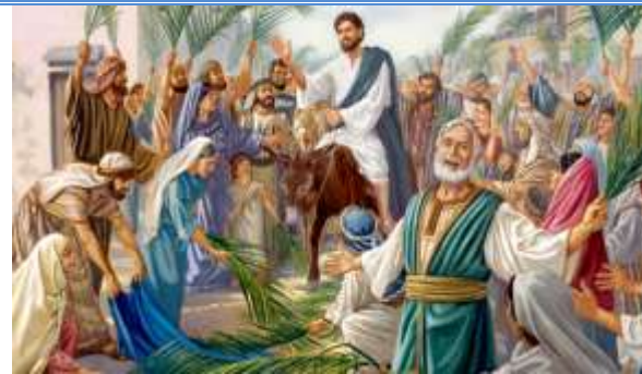
Entrada Triunfal de Jesus em Jerusalém.